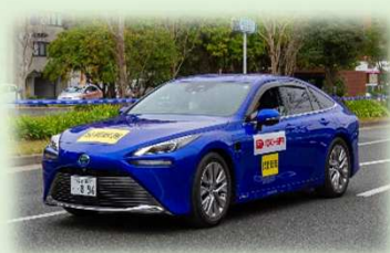
【技術総務車を務めた水素自動車】