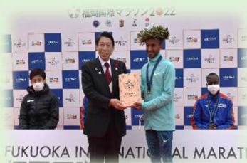
【県産杉を用いた優勝盾】