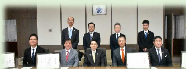
【知事による感謝状贈呈式の様子】